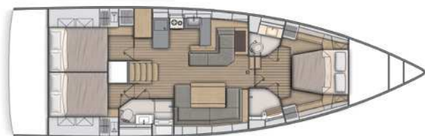
Lower deck / Version 3 Kabinen 2 Bäder