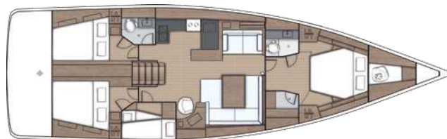
Lower deck / Version 4 Kabinen 2 Bäder