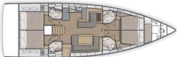
Lower deck / Version 4 Kabinen 4 Bäder