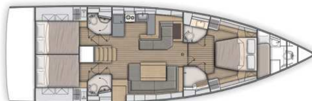
Lower deck / Version 3 Kabinen 3 Bäder