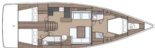
Lower deck / Version 3 Kabinen 2 Bäder