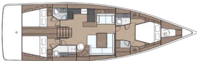
Lower deck / Version 3 Kabinen 3 Bäder